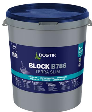
BLOCK B786 TERRA SLIM (K100 SCHWARZ)

B786 TERRA SLIM je jednozložková hydroizolačná hmota bez rozpúšťadiel a plnív na báze latex-bitúmenu. Vďaka tixotropnému zloženiu je možné B786 TERRA SLIM natierať, valcovať alebo striekať aj na zvislé plochy. Po zaschnutí je náter elastický, nepriepustný pre vodu a odolný voči prirodzene sa vyskytujúcim látkam, ktoré sú agresívne voči betónu. Používa sa na vytváranie trvalých tesnení na nosných podkladoch z betónu, pórobetónu, omietky a muriva. Možno použiť aj ako ochranný náter alebo riediť vodou v prípade použitia ako penetračný náter.