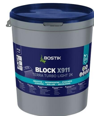
BLOCK X911 TERRA TURBO LIGHT (TURBOTEC 2K SPECIAL)

BLOCK X911 TERRA TURBO LIGHT je dvojzložkový, vodeodolný, flexibilný a trhliny premostujúci produkt na univerzálne použitie ako hydroizolačná kaša a ako pružný polymérom modifikovaný hrubý náter. Možno použiť aj na hydroizoláciu konštrukcií v kontakte so zemou a ako hydroizoláciu pod keramické obklady a dlažbu.