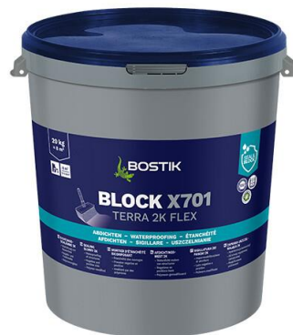
BLOCK X701 TERRA 2K FLEX (K11 FLEX SCHLÄMME GRAU)

BLOCK X701 TERRA 2K FLEX je dvojzložková tesniaca kaša, pozostávajúca zo suchej malty a nízkoviskózneho plastovej emulzie, ktorá sa nanáša na minerálne, nosné a sadrové podklady, čím vzniká mimoriadne dobre priľnavá, rýchlo zaťažiteľná hydroizolačná vrstva, ktorá môže byť použitá aj proti vlhkosti z negatívnej strany. Po vytvrdnutí je výrobok odolný voči mrazu a morskej vode a dokáže premostiť vlasové trhliny.